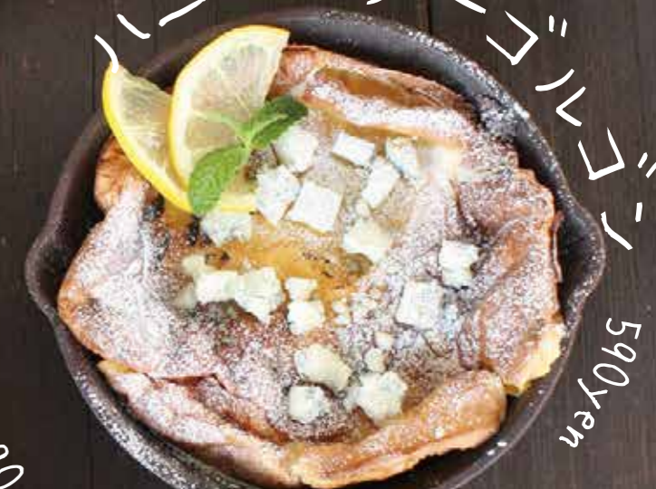
ハニーバターゴルゴン